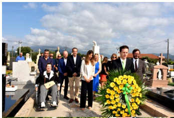
Dia da Seara