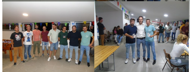
Projeção do vídeo/ Torneio Matraquilhos /Acordes Vocais